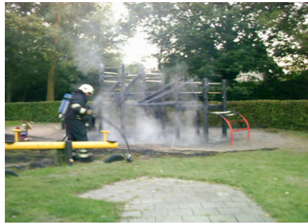
Alles wat overblijft van een eens zo kleurig speeltoestel

In de avond van zondag 5 augustus wordt Zanddonk Zuid gealarmeerd door een enorme zwarte rookwolk. Wanneer dan even later ook nog sirenes te horen zijn loopt heel de buurt uit richting het speelterreintje in de hoek van de Debussystraat, waar een speeltoestel in lichterlaaie staat. "Daar gaat weer iets moois", zucht een van de omstanders, "wie weet wanneer we er iets voor terug krijgen", vraagt een ander zich af.